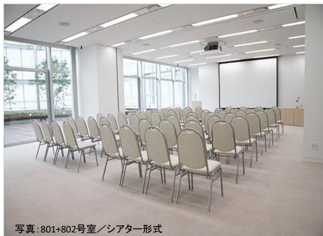
写真:801+802号室／シアター形式